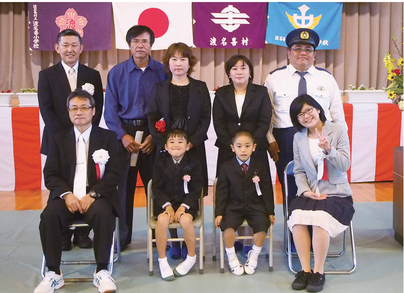
平成29年度 渡名喜村立渡名喜小学校入学式