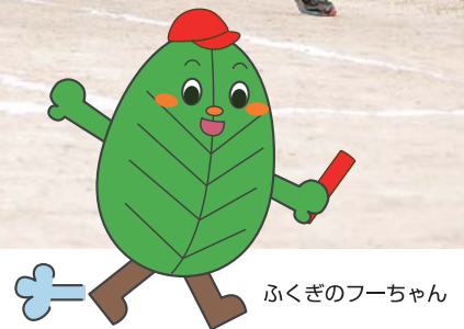
ふくぎのフーちゃん