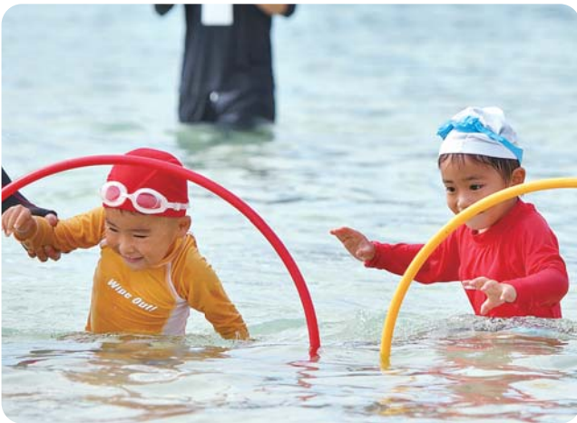
一生懸命な幼稚園児の姿が可愛い水中障害物競走。

大正時代から受け継がれている渡名喜村の伝統行事「水上運動会」が6月28日、東の浜にて開催されました。渡名喜幼小中学校児童生徒、PTA、村民や、この日のために島外から集まった多くの人々が参加。海の中での紅白玉入れ、騎馬戦、綱引きや全児童生徒による紅白リレー等がおこなわれ、普段は静かな浜辺が「となきっ子」へ送られる声援で賑わいました。