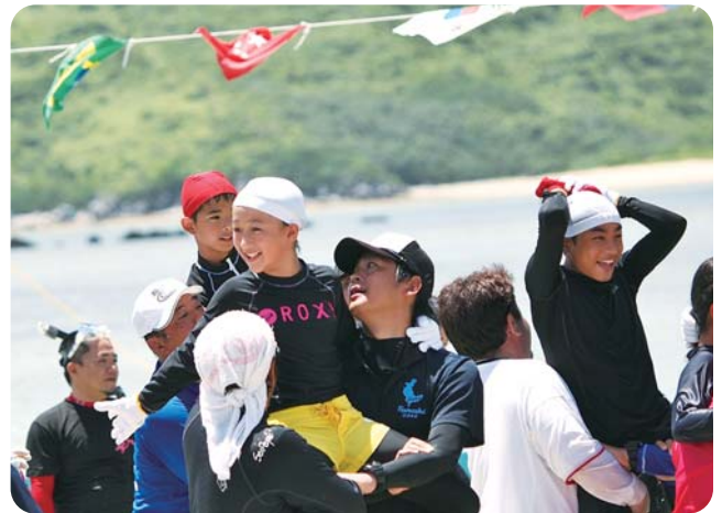
PTA、村民が馬になり子どもたちを支える海での騎馬戦。